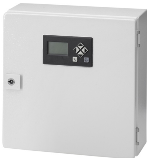
Fig. 1 LT3-F boîtier avec UI300-LT-V2