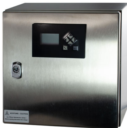
Fig. 2 LT3-F dans un boîtier en acier inox avec UI300-LT-V2 et couverture supplémentaire pour IP65