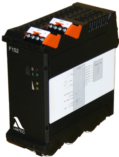
Fig. 1 F152 ...